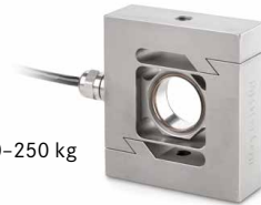
CS P2 50-250 kg